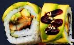
K4. CATERPILLAR 128,- Grillet ål, avocado, agurk og teriyaki sauce Toppet med avocado, teriyaki sauce og sesam