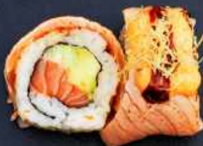
K5. FIRE DRAGON 128,- Laks eller paneret rejer, avocado og agurk Toppet med grillet laks, teriyaki sauce og chilimayo