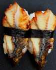
N11. UNAGI GRILLET ÅL 27kr / 98kr