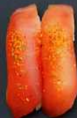
N6. TUN MED CHILI 23kr / 85kr