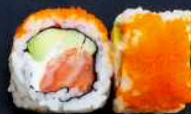
U6. PHILADELPHIA ROLL 82,- Laks, flødeost, avocado og agurk Toppet med masago