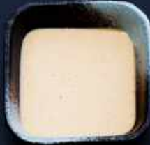
T2. GOMA 10,-