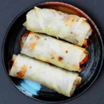
A6. HJEMMELAVET FORÅRSRULLER 3 stk. 35,-