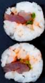
H5. TUN 46,- MED CHILI