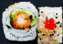
U10. CRISPY FISK 78,- Paneret laks, chilimayo, avocado og agurk Toppet med sesam og masago