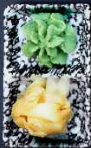
T7. WASABI & INGEFÆR 10,-