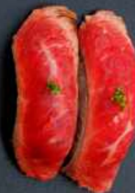
N12. BEEF TATAKI 26kr / 92kr