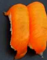
N4. LAKS CARPACCIO 23kr / 80kr