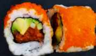
U12. LAKSETARTAR ROLL 82,- Laksetartar, avocado og agurk Toppet med masago