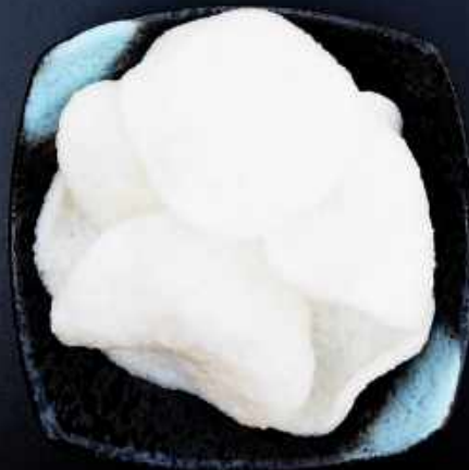
T8. REJECHIPS 28,-