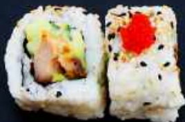
U2. CRISPY KYLLING 78,- Crispy kylling, chilimayo avocado og agurk Toppet med sesam og masago