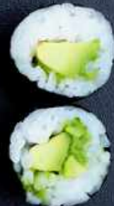
H8. AVOCADO 40,-