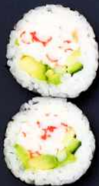
F1. CALIFORNIA BIG 58,- Surimi, avocado og agurk