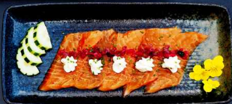
C2. LAKS CARPACCIO 85,- Soyamarineret laks toppet med flødeost forårslæg og marineret rødløg