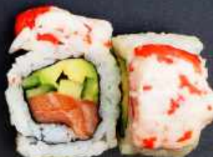
K8. YAMMI CRAB 118,- Laks, avocado og agurk Toppet med med surimi