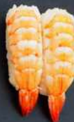
N8. REJE 21kr / 76kr