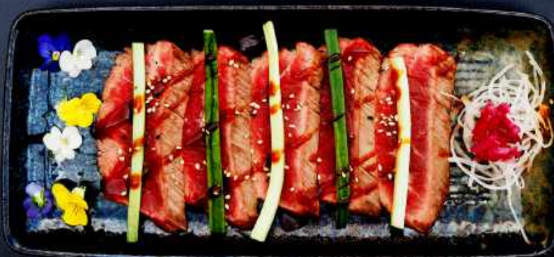
C3. BEEF TATAKI 80,- Grillet oksekød med peber toppet med agurk, sesam