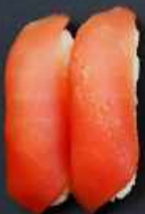
N5. TUN 23kr / 83kr