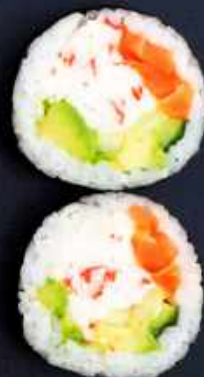
F8. LAKS DELUXE BIG 65,- Laks, surimi avocado og agurk