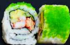
U11. GREEN CALIFORNIA 89,- Krebsehaler, avocado og agurk Toppet med wasabi masago