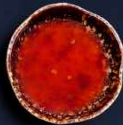
T6. SØD CHILI 10,-