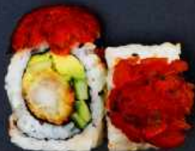
K7. YANA ROLL 118,- Paneret rejer, chili mayo, avocado og agurk. Toppet med tuntatar eller laksetatar