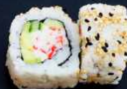
U3. CALIFORNIA 76,- Surimi, avocado og agurk Toppet med sesam