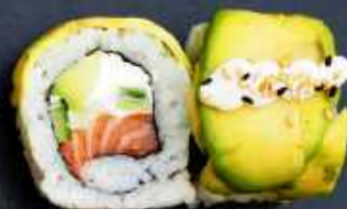
K6. SHAKE ROLL 128,- Laks, flødeost, avocado og agurk Toppet med avocado japansk mayo og sesam