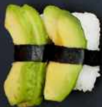
N9. AVOCADO 20kr / 70kr