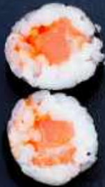
H2. LAKS 42,-