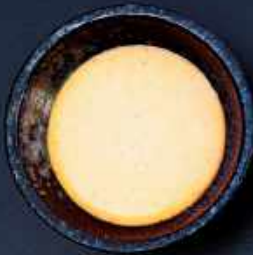
T4. CHILIMAYO 10,-