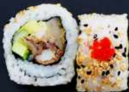
U8. SPIDER 109,- Softshell crab, avocado, agurk, teriyaki sauce Toppet med sesam masago