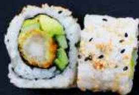
U7. EBI FURAI 89,- Paneret reje, chilimayo, avocado og agurk Toppet med sesam