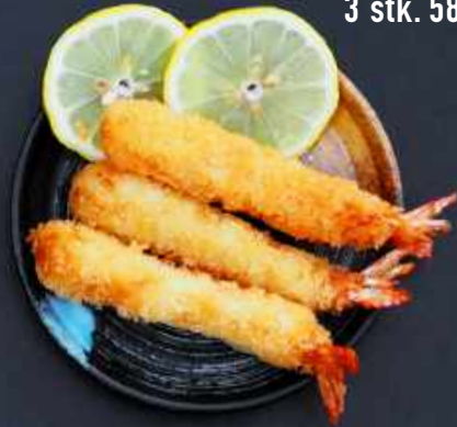
A5. TEMPURA REJER 3 stk. 58,-