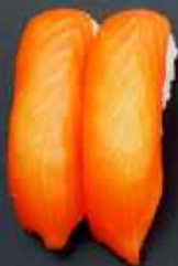
N1. LAKS 21kr / 78kr