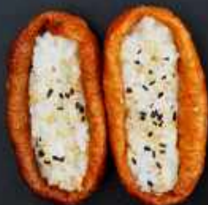
N10. INARI TOFU 20kr / 70kr