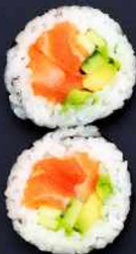
F2. LAKS BIG 65,- Laks, avocado og agurk