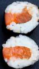
H3. LAKS 44,- MED CHILI