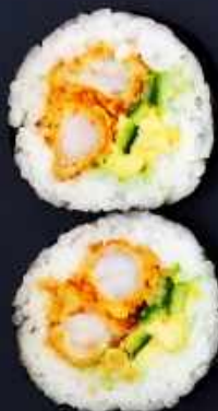
F5. EBI FURAI BIG 65,- Paneret reje, chilimayo avocado og agurk