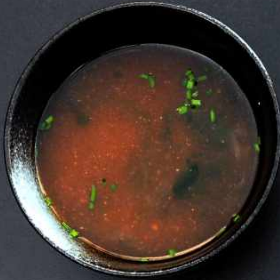
A1. MISO SUPPE 30,-