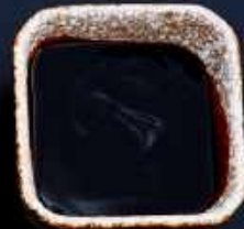
T3. TERIYAKI 10,-