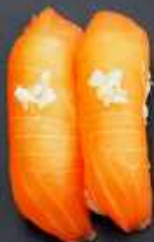
N2. LAKS MED HVIDLØG 22kr / 82kr