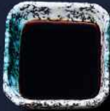
T1. SOYA 10,-