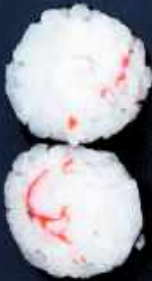
H1. SURIMI 42,-