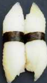
N7. HVIDFISK 23kr / 88kr