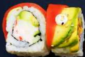
K1. RAINBOW 116,- Surimi, avocado og agurk Toppet med laks, tun, reje, avocado og japansk mayo