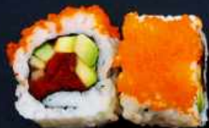
U4. TUN TARTAR 89,- Tun tatar, chilisauce, avocado og agurk Toppet med masago