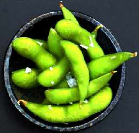
A2. EDAMAME BØNNER 30,-