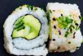
U9. GREEN ROLL 69,- Avocado og agurk Toppet med sesam og purløg