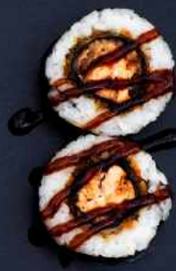
F4. TEMPURA LAKS BIG 76,- Dybsteget laks, chilimayo og teriyaki sauce