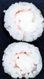
H6. EBI REJER 42,-