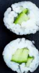
H7. AGURK 38,-