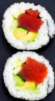
F3. TUN BIG 69,- Tun, avocado og agurk