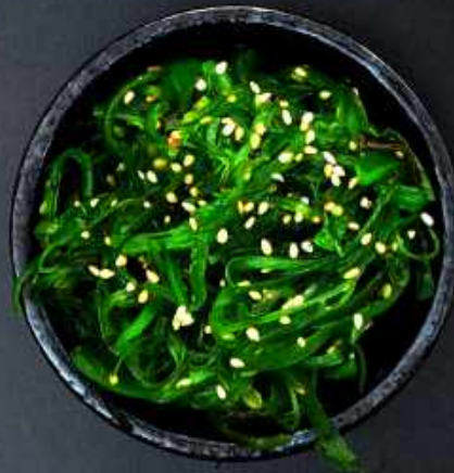
A3. TANGSALAT 45,-