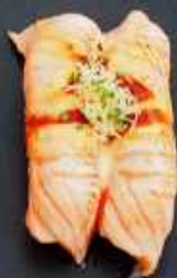
N3. GRILLET LAKS 22kr / 80kr