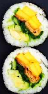
F7. VEGETAR BIG 65,- Tofu, mango, avocado og agurk