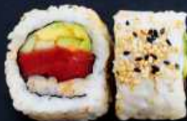
U5. SPICY TUN 82,- Tun, chilisauce, avocado og agurk Toppet med sesam