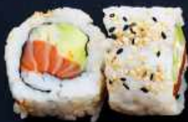
U1. LAKS ROLL 82,- Laks, avocado og agurk Toppet med sesam