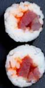
H4. TUN 43,-