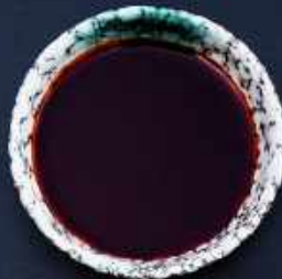
T5. TATAKI 10,-