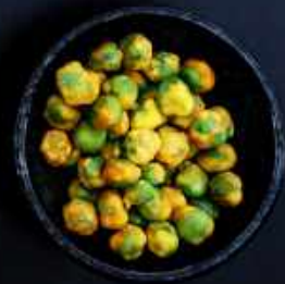
T9. WASABI ÆRTER 35,-