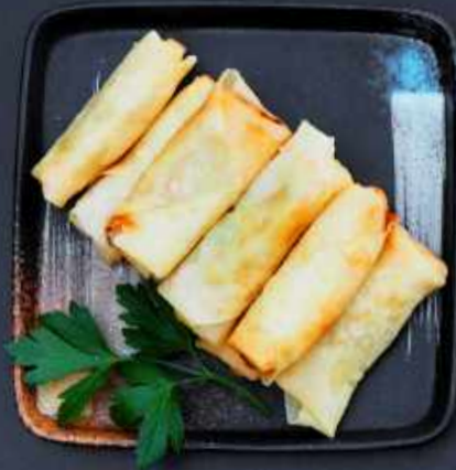
A4. MINI FORÅRSRULLER 8 stk. 49,-