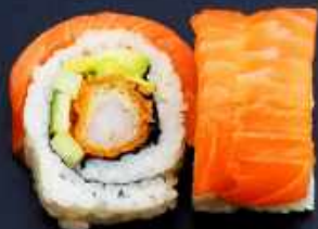
K2. DYNAMITE 118,- Paneret reje, chilimayo, avocado, og agurk Toppet med laks