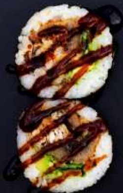
F6. SPIDER BIG 65,- Softshell crab, avocado, agurk og teriyaki sauce