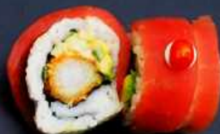
K3. RED DRAGON 128,- Paneret reje, avocado og agurk Toppet med tun, japansk mayo og chilisauce